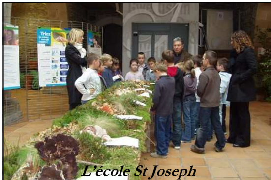
L'école St Joseph