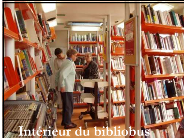
Intérieur du bibliobus

Nous rappelons que le bibliobus dépose deux fois dans l'année de nombreux ouvrages (environ 350) : romans, policiers, documentaires, albums jeunesse, BD... afin de renouveler la collection de la bibliothèque. En plus de cet apport, la navette de la Bibliothèque du Finistère passe le dernier vendredi de chaque mois pour répondre aux besoins et envies de nos lecteurs. Effectivement, vous pouvez remplir une fiche indiquant l'auteur et le titre du livre que vous souhaiteriez découvrir, même s'il est récent, ou bien le thème de lecture (science-fiction, romans historiques, contes...). Ces fiches sont expédiées régulièrement à la Bibliothèque du Finistère qui peut ainsi répondre à votre demande.