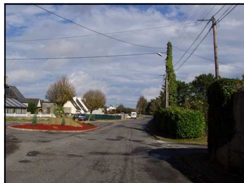
Rue de la Résidence