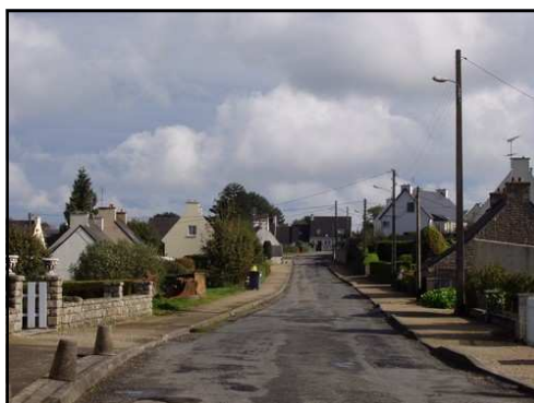
Rue de Kernaman

Participation communale de l'ordre de 55 000 €