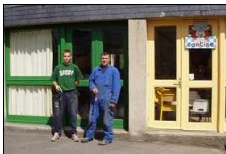
Ecole du Roudour

Les employés communaux préparent la rentrée : L'ensemble des peintures des ouvertures extérieures de l'école ont été refaites.