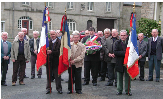
Les membres des associations d'anciens combattants avec leurs porte-drapeaux

Après le dépôt de gerbe au monument aux morts, une minute de silence et de recueillement a été observée par l'assemblée.