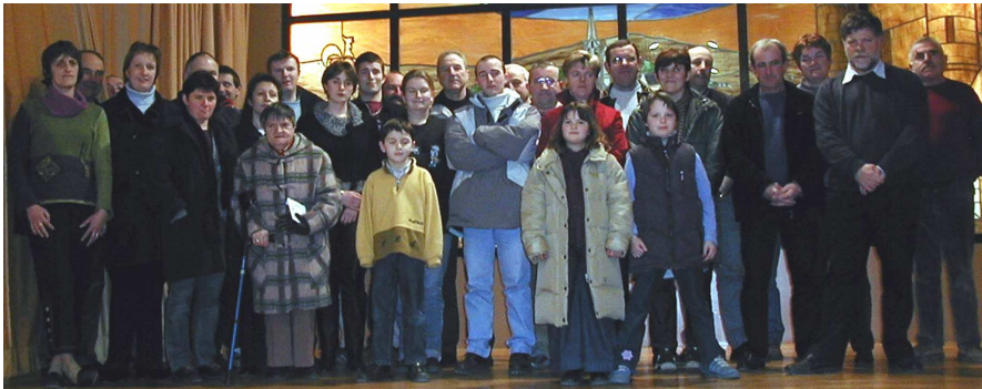
LES PARTICIPANTS AU CONCOURS AVEC LES MEM- BRES DU JURY

Les critères de sélection étaient notamment basés sur la qualité des décorations qu'elles soient ou non lumineuses et également sur l'homogénéité de l'ensemble. Les décorations devaient aussi bien être visibles de jour comme de nuit. L'originalité des ornements utilisés ou la mise en scène des décors ont été des critères déterminants dans le classement des lauréats.