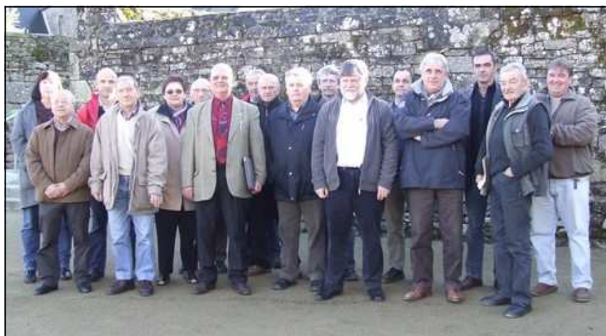
Les membres du SIVU