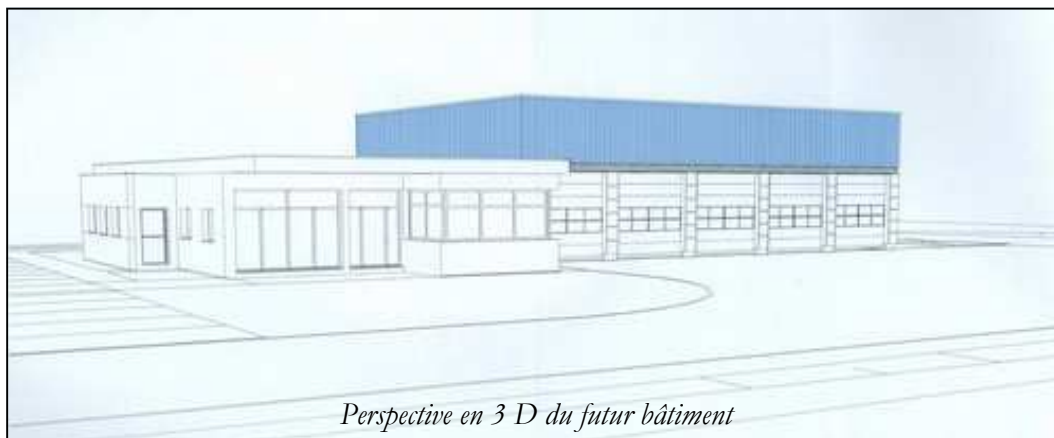
Perspective en 3 D du futur bâtiment

L'inauguration du nouveau Centre d'Incendie et de Secours de Guerlesquin est prévue en Mars / Avril 2009.